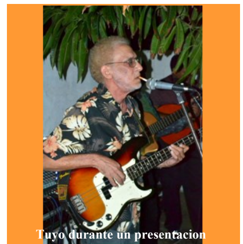
Tuyo durante un presentacion

Tuyo su prome toca den su bida den menos cu 24 ora cu el a mishi cu un baho pa prome biaha den un Stadion completamente yen!